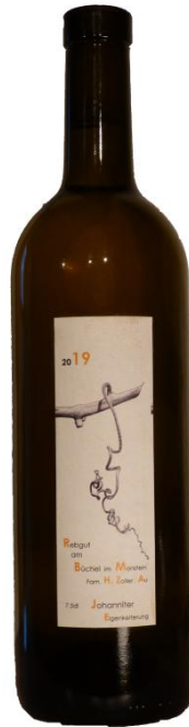
Johanniter 2019 Eigenkelterung