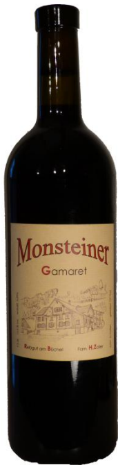
Gamaret 2018 7.5 dl Fr. 15.-