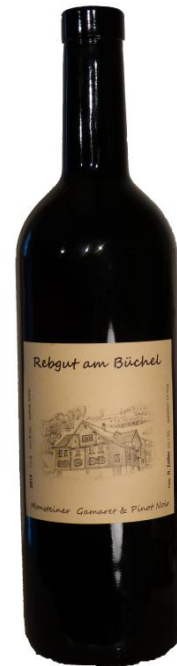
Gamaret & Pinot Noir 7.5 dl Fr. 15.-

Der Wein wird aus Gamaret Trauben gekeltert, die auf ca. 16 a sandsteinhaltigem Boden im Gebiet Monstein (Au/SG) gedeihen. Durch den Terrassenbau, riguroses Zurückschneiden und intensive Laubarbeit kann eine möglichst ökologische Anbauweise gewählt werden. Die reifen Trauben werden in Thal beim Ochsen Torkel zu einem harmonischen Rotwein gekeltert. Dass sich der Wein jedes Jahr von seiner Struktur und seinem Geschmack unterscheidet, spricht für seine Natürlichkeit.